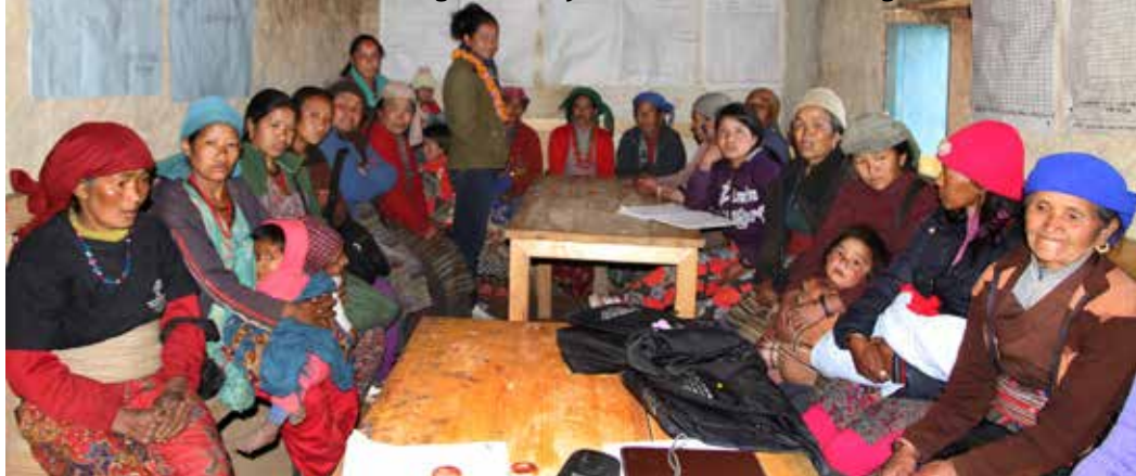
I Kommunekontoret i Sagar-Bakanje var fremmødet stort og til tiden

WEP er jo et samarbejde mellem vores Himalayan Project Nepal (HIPRON) og den Danske Ambassade. Vores danske Himalayan Project (HP) står helt udenfor som en tilknyttet supporter. Derfor kunne jeg egentlig bare betragte WEPs svagheder udefra og så gå ind og bearbejde de stærke sider. Måske skulle jeg have besøgt Bakanje et halvt år før, for at følge op på programmet, mens det endnu var i no-