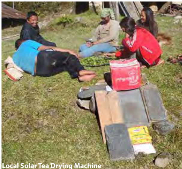
Local Solar Tea Drying Machine

Jeg prøvede for sjov, sammen med kvindegruppen i Sete, at lave god the. De leverede adskillige kilo blade, men efter sorteringen var der til deres skuffelse kun 100 gram tilbage. Imens sad vi og drak af deres færdiglavede the; den smagte af græs. Derefter sad vi og nuldrede de frasorterede skudspidser lige akkurat så meget, at blad-overfladen var brudt. Det syntes de var mærkeligt, for de plejede at stampe bladene i en morter til saften flød. Jeg pakkede det hele ind i en god plasticpose, som blev lukket, og lagt på varmen i hjørnet af komfuret natten over. Næste morgen havde det lidt the-lugt og halvdelen af bladene var blevet sortbrune. Vi havde ikke tid til at vente endnu en dag, så jeg lavede straks en sol-luft-tørrer af en