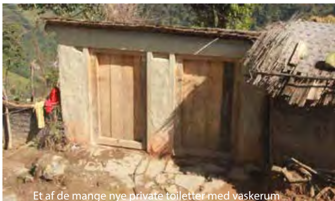
Et af de mange nye private toiletter med vaskerum