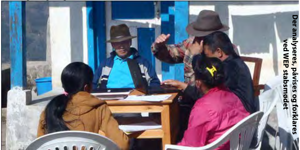
Der analyseres, påvises og forklares ved WEP stabsmødet