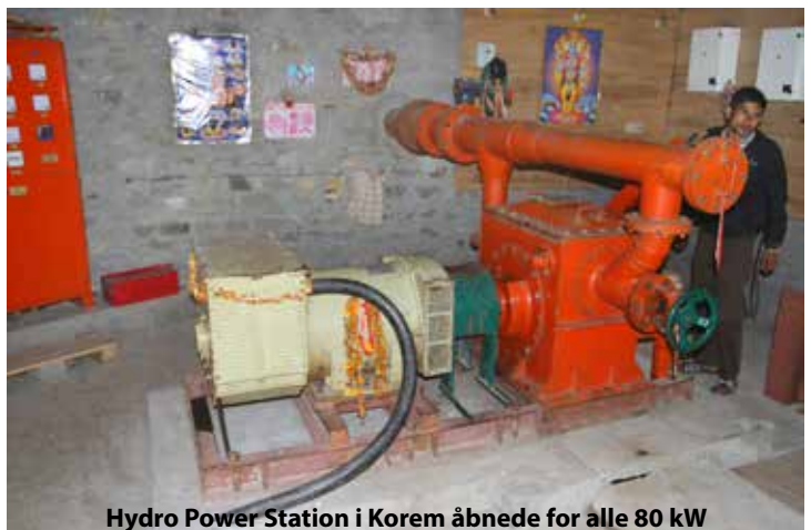
Hydro Power Station i Korem åbnede for alle 80 kW

kan køres helt til Kathmandu ad den nye vej og indbringe 100 Rupee kiloet, 3 millioner Rupee til Bakanjes kvinder, som normalt har en indtægt på nul til 1000 Rupee om året. Men selvfølgelig holder den ikke. Man kan ikke sådan bare sælge 30 tons til toppris hele året. Men så snakkede vi med ejerne af det nye vandkraftværk i Korem, som producerer 80 kW. Det fordeles til 400 husstande, men kun til belysning. Hver husstand må bruge 150 kWh. Prøv at tænke på dit hjem. Det svarer til fire 40 W pærer. Men elværket står stille i dag-