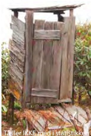
Tæller IKKE med i statistikken

Bakanje. For et halvt år siden begyndte han at føre sig vældig frem med Sundhedsministeriets nye program, at gøre hele Nepal til "Open Defecation Free Area", hvilket betyder at ingen længere må gå ud på marken og skide, hvilket 80% af Bakanje's befolkning gjorde. Men det betyder jo så, at de er nødt til at bygge et toilet. Og det forunderlige skete. På under et halvt år har næsten alle husstande bygget et fint toilet i sten med septiktank, og mange har også bygget et vaskehus nu de var i gang. Før havde 15% af befolkningen eget toilet. Nu har 90%. Kommunesekretæren er selv forundret over sin succes, for i hans tre andre kommuner er de knap kommet i gang. Ingen tvivl om at vores bevidstgørelsesprogrammer har medvirket til den hurtige succes, men også hans trusler om ikke at ville udskrive ID-papirer og udbetale pensioner har medvirket. Normalt er det svært at lokke folk til at gøre noget uden lyden af klingende mønt i baggrunden, men denne gang har det været et stort fællesprojekt, hvor naboer hjalp hinanden med at bygge og at købe ind i fællesskab. At projektet så betyder, at et halvt ton gødning daglig bliver anbragt i et hul i jorden i stedet for som gødning til marken, er jo en anden historie. Men den del tager