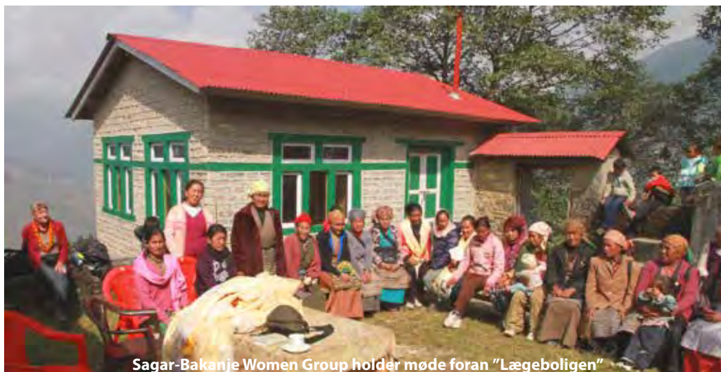
Sagar-Bakanje Women Group holder møde foran "Lægeboligen"